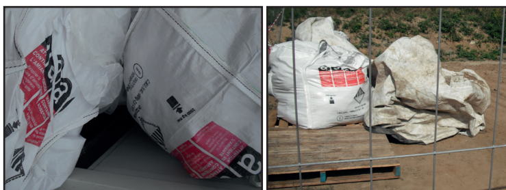
Big bag de déchets amiantés

Le coût des interventions par des entreprises certifiées et qualifiées prend en compte les obligations réglementaires suivantes :