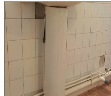
Colle amiantée sous faïence

Si le propriétaire ou le locataire réalise lui-même l'intégralité des travaux, il lui est également recommandé de faire effectuer cette recherche pour protéger sa propre santé mais aussi celle des tiers qui l'entourent. Si plusieurs conditions sont réunies, les dispositifs du RAT et du RAD s'appliquent de façon combinée. Pour plus de précisions, consulter la brochure "Les obligations de repérage avant travaux : les cas d'exemption et de dispenses" accessible sur site du ministère du travail.