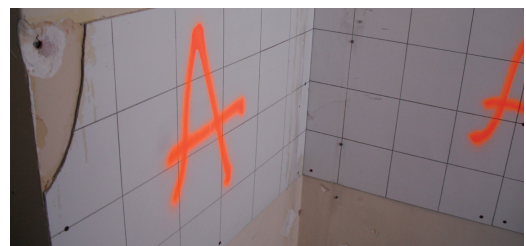
Repérage de colle amiantée sous faïence

Les repérages détaillés ci-dessus sont parfois insuffisants, voire inexistant pour certains d'entre eux. En effet, selon l'ampleur des travaux de rénovation envisagés, le donneur d'ordre (propriétaire ou locataire), n'a pas la certitude que tous les MPCA potentiellement présents dans la zone de travaux ont bien été identifiés.