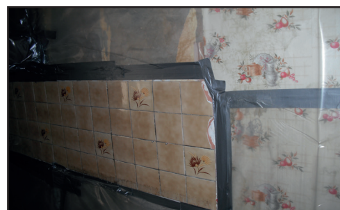
Préparation aux travaux de retrait de colles sous carrelages et sous faïence (sous-section 3)